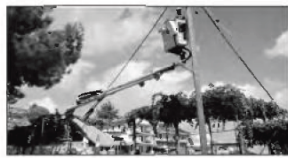
Αναβάθμιση 100% του οδικού φωτισμού με LED στις κοινότητες Άλωνα και Πολύστιπου

Οι δύο κοινότητες ανέθεσαν στο Ενεργειακό Γραφείο Κυπρίων Πολιτών την κα-