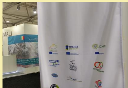
COP23, Νοέμβριος 2017