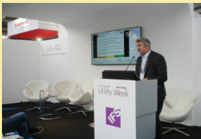
European Utility Week, Οκτώβριος 2017

Αρκετές εκδηλώσεις που σχετίζονται με το έργο ENERFUND έχουν οργανωθεί σε ολόκληρη την Ευρώπη. Οι επόμενες εκδηλώσεις και τα εκπαιδευτικά σεμινάρια έχουν προγραμματιστεί ήδη για τις αρχές του 2018. Μπορείτε να επικοινωνήσετε μαζί μας ή να επισκεφθείτε την ιστοσελίδα μας http://enerfund.eu/ για να μάθετε περισσότερα σχετικά με τις δράσεις του έργου και να συμμετάσχετε στις εκδηλώσεις που διοργανώνονται στη χώρα σας.