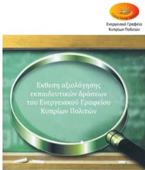
Απρίλιος - Ιούνιος 2009 και Ακαδημαϊκό έτος 2010

Η έκθεση ετοιμάστηκε με την ολοκλήρωση των εκπαιδευτικών δράσεων του Ενεργειακού Γραφείου Κυπρίων Πολιτών που ξεκίνησαν από τον Απρίλιο του 2009, με σκοπό την αξιολόγηση τους.