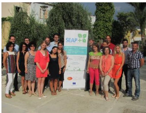
Συνάντηση εταίρων του έργου SEP PLUS στην Λευκωσία